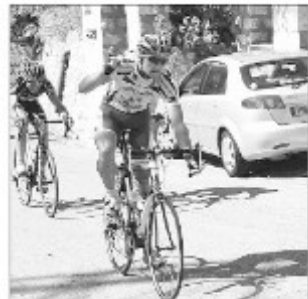
C'est finalement au sprint que s'est disputée l'arrivée du Grand Prix des Trois-Communes, au Roc.