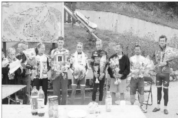
La remise des prix du trophée des Grimpeurs à la Colmiane.